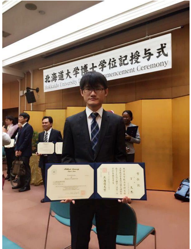
丁博士取得法学博士学位后，给我校发来的感谢状